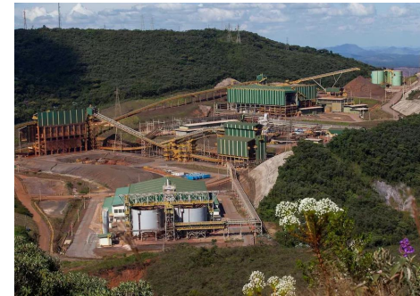
Complexo de Germano em Mariana, na Região Central de Minas Gerais. — Foto: Samarco/Divulgação https://g1.globo.com/minas-gerais/desastre-ambiental-em-mariana/noticia/samarco-solicita-licenca-para-retomar-operacoes-no-complexo-de-germano.ghtml