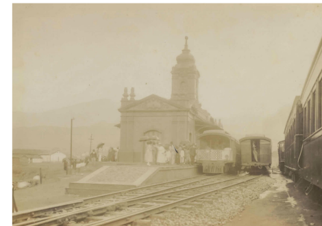
Estação ferroviária de Mariana no dia da inauguração, com o presidente da República. 1922. http://www.siaapm.cultura.mg.gov.br/modules/fotografico_docs/photo.php?lid=26773