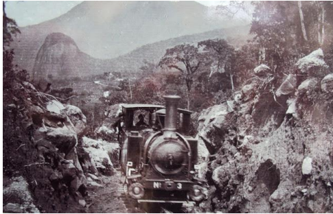
Locomotiva a vapor no trecho de subida da serra do Porto de Mauá até Inhomirim. Final do século XIX. Acervo Museu Imperial de Petrópolis. http://tremdaserradoriodejaneiro.blogspot.com/2016/07/estrada-de-ferro-principe-do-grao-para.html