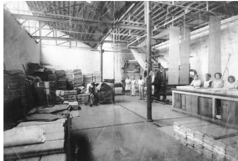
Interior da Sala de Pano da Companhia Industrial Ouropretana (Fábrica de Tecidos), Ouro Preto MG, s/d Autor desconhecido [Acervo pessoal Ephigênia Antônia de São José Ignácio dos Anjos] https://www.vitruvius.com.br/revistas/read/arquitextos/17.196/6225