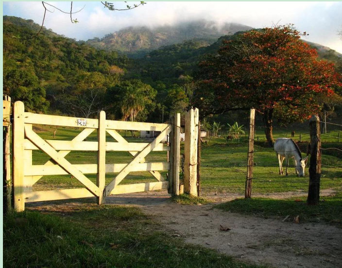
Imagem de uma porteira.