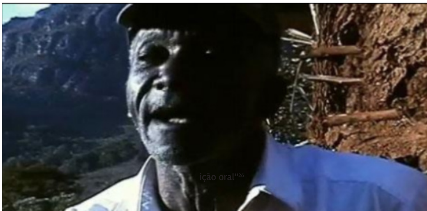
Frame retirado do curta-metragem “Vissungos: fragmentos da tradição oral” 26